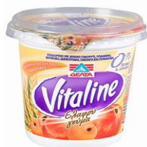
Γιαούρτι με φρούτα