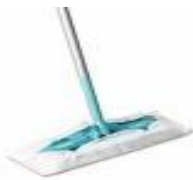
Πανάκια ξεσκονίσματος μιας χρήσης

Αναζητήστε και άλλα παραδείγματα από την καθημερινή μας ζωή, όπου μια καινοτόμος ιδέα συνέβαλε στη βελτίωση της ποιότητας ζωής.