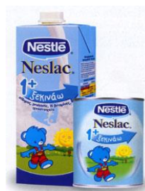
Γάλα με βιταμίνες και σίδηρο