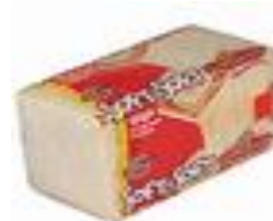
Ψωμί για τوست μόνο ψίχα