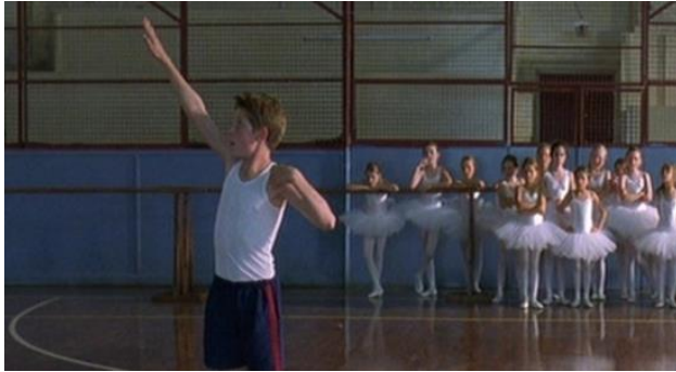
Από την ταινία «Billy Elliot»

Αφού παρακολουθήσεις την ταινία «Billy Elliott», απάντησε στις παρακάτω ερωτήσεις: